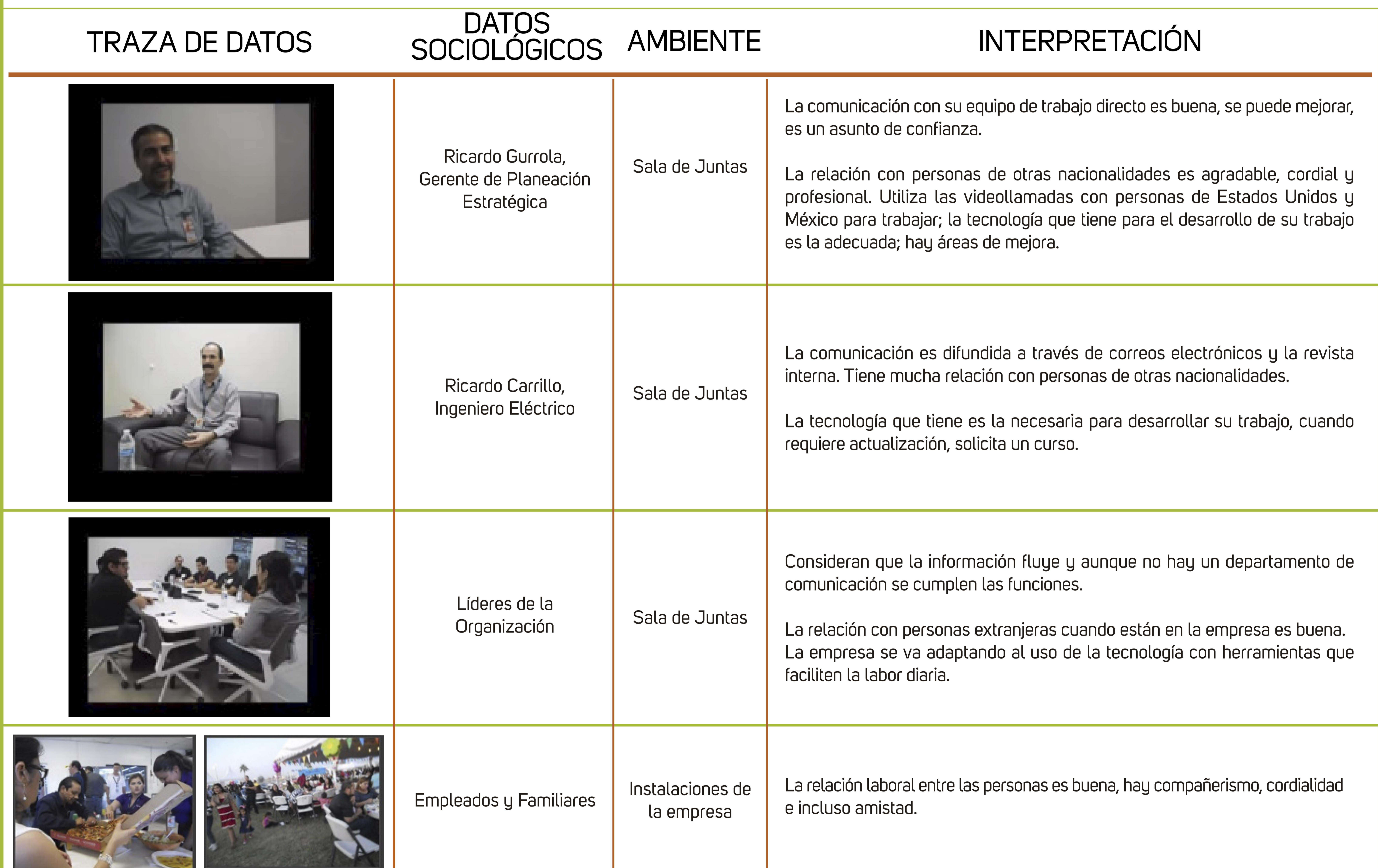
Tabla 1. Creación en su versión francesa por Chabert, G. (2017), adaptada al español por Gallegos, A. (2018).

Se utilizó el enfoque cualitativo el cual, según Hernández[2], "se enfoca en comprender y profundizar los fenómenos, explorándolos desde la perspectiva de los participantes en un ambiente natural y en relación con el contexto". Para la recolección de información se utilizaron las técnicas de observación participante y no participante; la entrevista semiestructurada, con el objetivo de que el entrevistado tenga más libertad al momento de responder; y el grupo focal con el fin de obtener información de sus propias experiencias. Población de estudio: Integrantes de EEMSA Mexicali, con una muestra por conveniencia de 8 personas para establecer contacto directo.